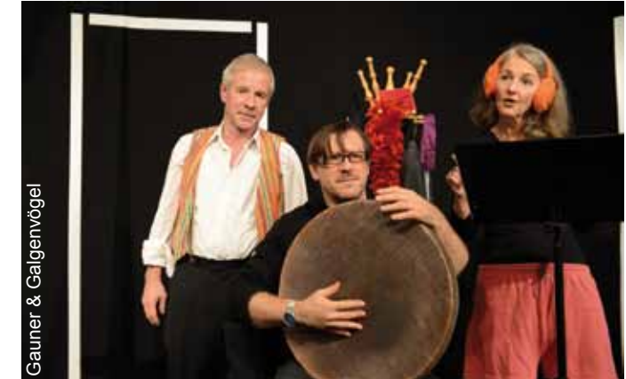
Gauner &amp; Galgenvögel