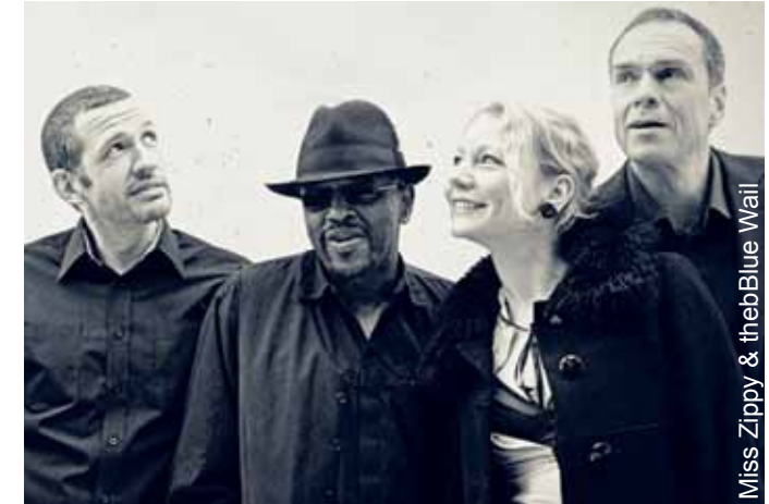
Miss Zippy & theBlue Wail